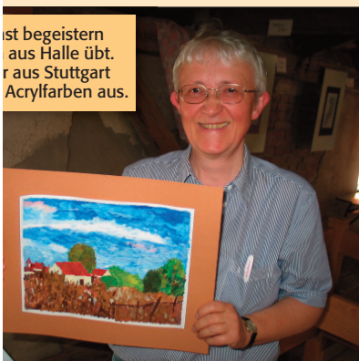
...st begeistern aus Halle übt. r aus Stuttgart Acrylfarben aus.